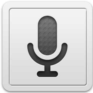
Logo de reconnaissance vocale souvent rencontré

La reconnaissance vocale est une technologie relativement récente, qui séduit énormément les professionnels et le grand public par son aspect pratique, ludique et ergonomique.